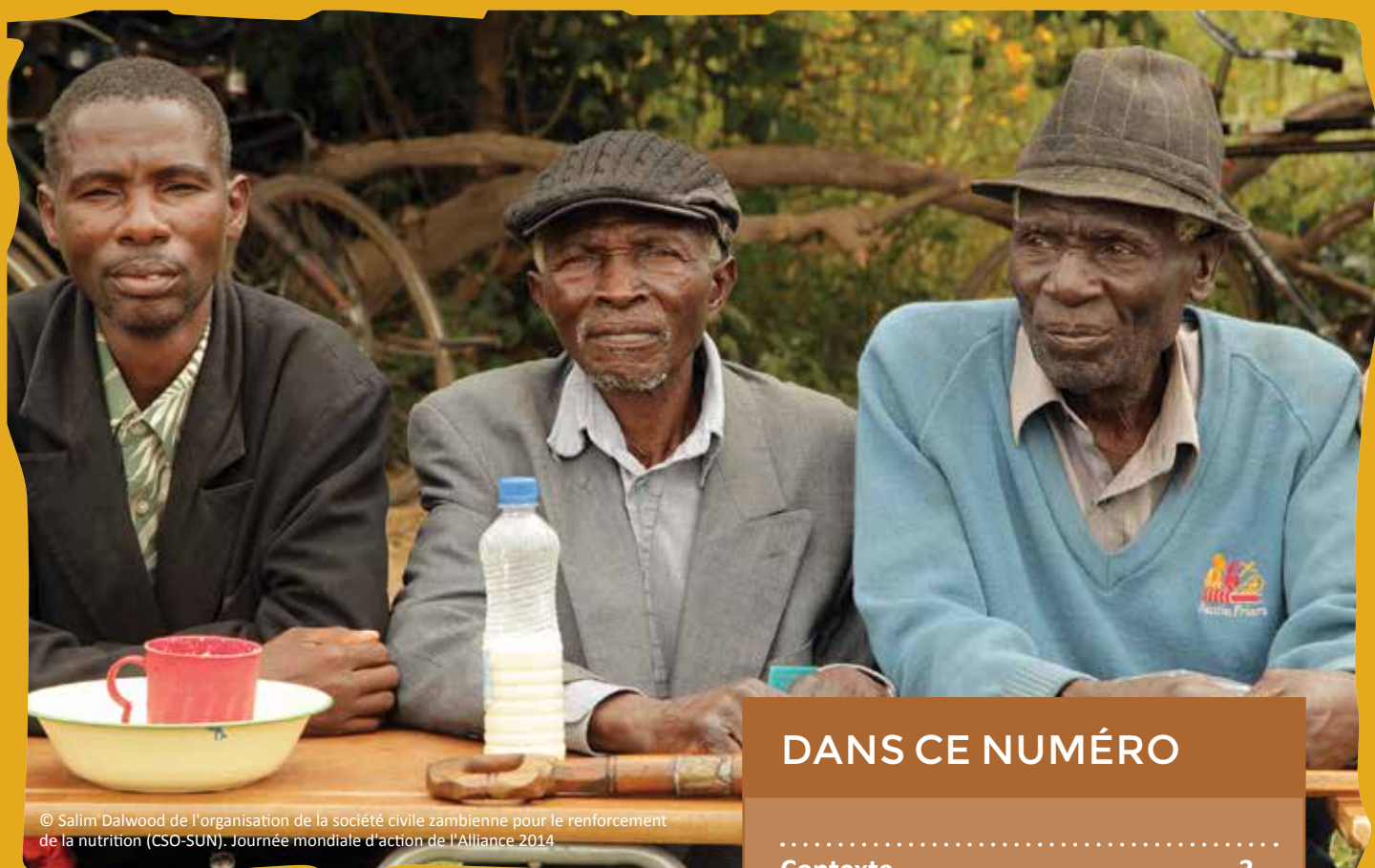
© Salim Dalwood de l'organisation de la société civile zambienne pour le renforcement de la nutrition (CSO-SUN). Journée mondiale d'action de l'Alliance 2014